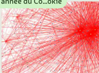
L'année du Co...okie