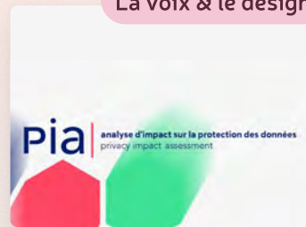
La voix & le design