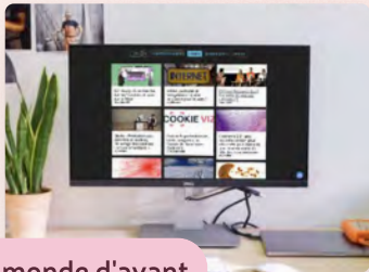
Le monde d'avant