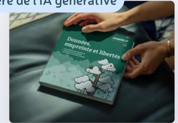
L'ère de l'IA générative